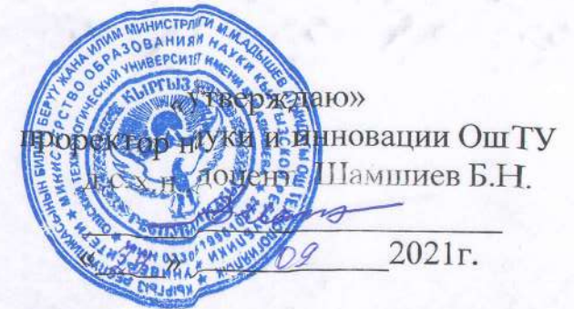
График открытых занятий ППС кафедры ЭиФ на первое полугодие 2021-2022 учебного года (Магистратура)