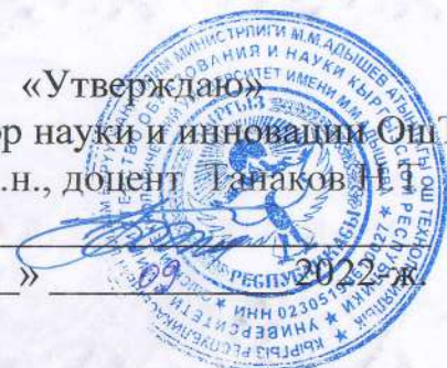
График открытых занятий ППС кафедры ЭиФ на первое полугодие 2022-2023 учебного года (Магистратура)