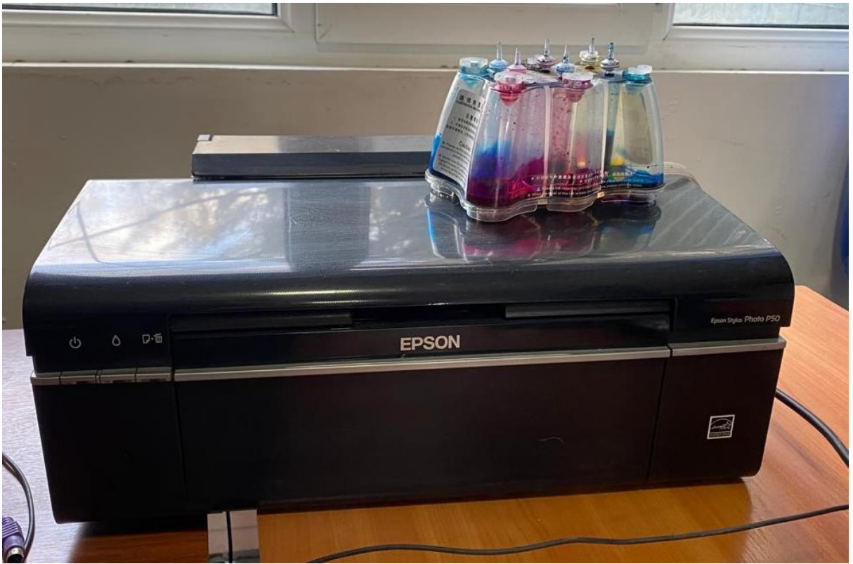
Сүрөт 9. Түстүү принтер