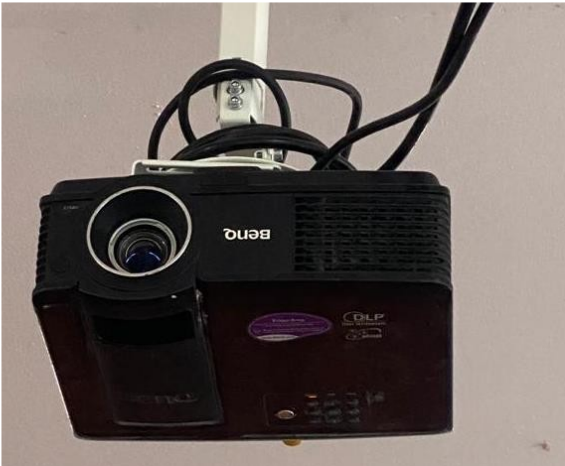
Сүрөт 5. Проектор Benq