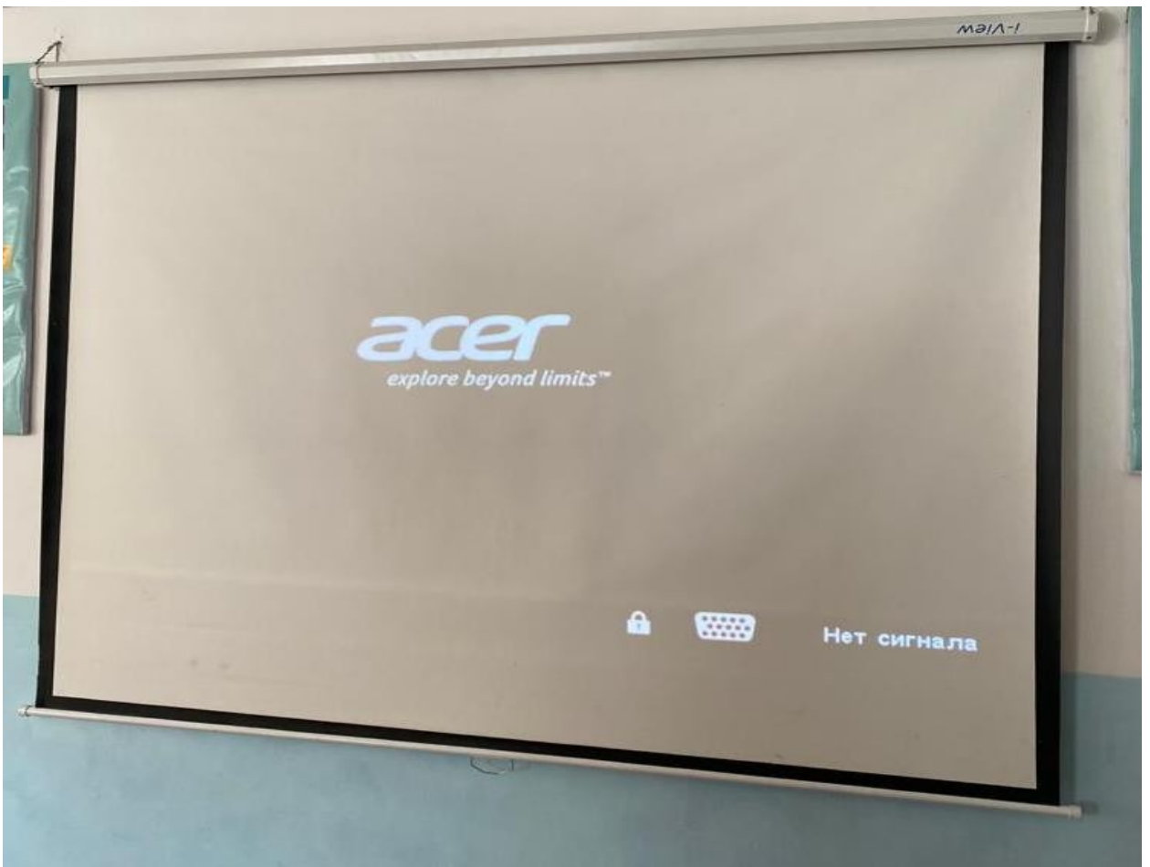
Сүрөт 7. Проектор үчүн доска