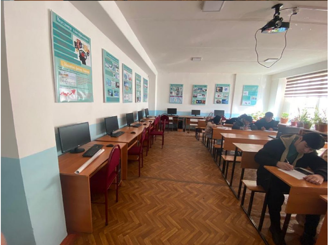
Сүрөт 3. 3/204 аудитория