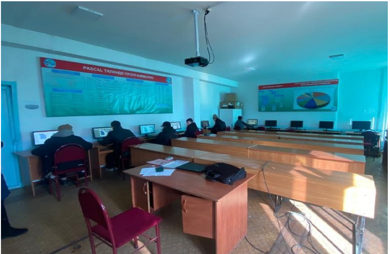
Сүрөт 4. 3/302 аудитория