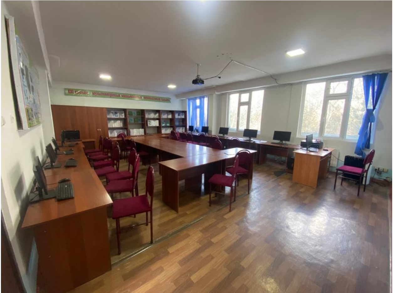
Сүрөт 1. 3/207 аудитория