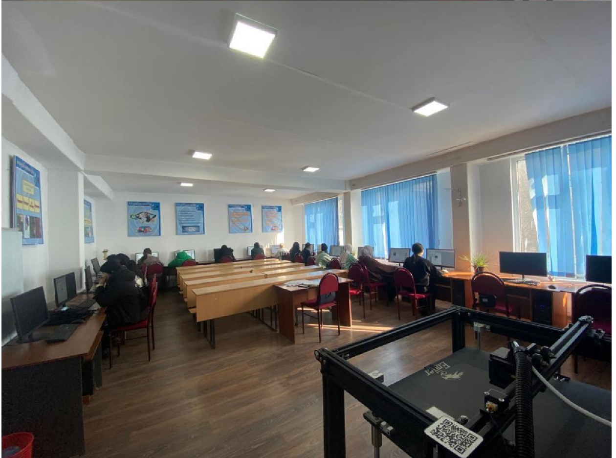
Сүрөт 2. 3/303 аудитория